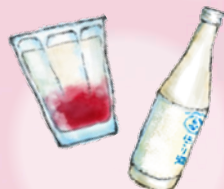
にごり酒：フルーツビネガー（ザクロ酢など） 1:5