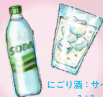
にごり酒：サイダー 1:1

冷やしてストレートが最高だけど、 たまには気分をかえてアレンジも。 完ぺきじゃないけど、不思議とおいしい。 自分好みの1杯を作っているとき、 知らないうちに、 愛着がじわりと生まれているから。 お酒が好きになる、そんなお酒たち。